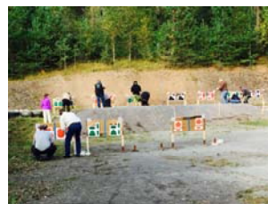
Bilder fra Norgesfelt som vi arrangerte sammen med Holmestrand PK på Eplerød.