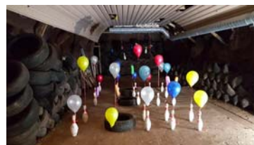
Juleavslutning i hula